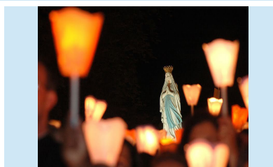
marche aux flambeaux

Inscriptions : Fr Charles frcharlesjesus@gmail.com tel : 06/45/54/65/23